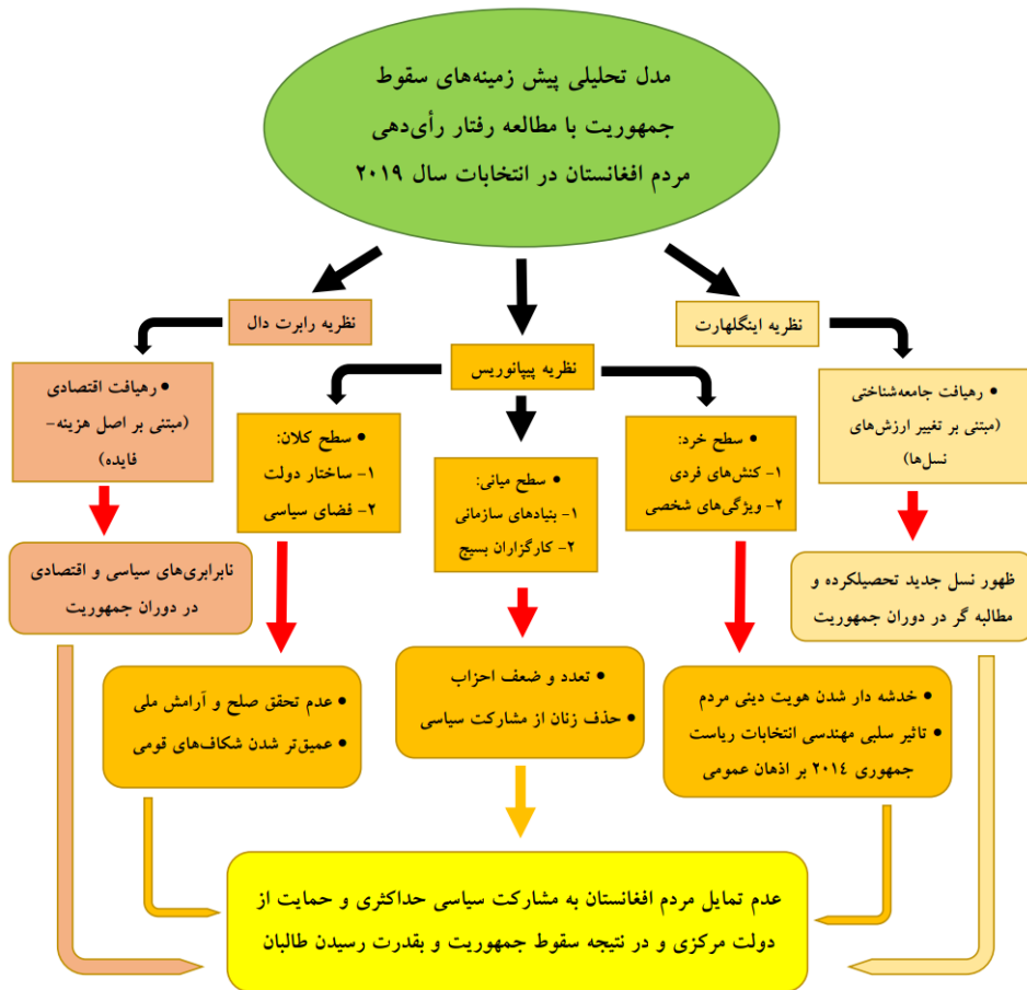
نمودار ۱: مدل تحلیلی پژوهش