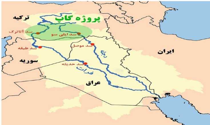
نقشه ۳. پیامدهای اجرای طرح گپ برای عراق و سوریه

ظرفیت سدها و سازه‌های ساخته‌شده و در حال ساخت سه کشور ساحلی بر فرات، بیش از سه برابر متوسط آورد سالانه این رود و بر دجله، حدود پنج برابر متوسط آورد سالانه این رود است (جدول ۲). در حالی که حدود ۸۹ درصد جریان فرات از ترکیه سرچشمه می‌گیرد، این کشور با سدسازی‌های گسترده، توانسته است بیش از متوسط آورد سالانه این رود را پشت سدهای ساخته شده ذخیره کند؛ ظرفیت ذخیره سدها و سازه‌های ترکیه بر دجله نیز حدود ۱۷،۶ میلیارد متر مکعب است؛ در حالی که متوسط جریان سالانه این رود در نزدیکی مرز ترکیه و عراق، حدود ۱۶،۸ میلیارد متر مکعب است (Mianabadi & Amini, 2019: 77).