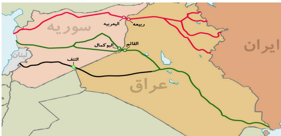
نقشه ۲ راه‌گذر زمینی تهران و مدیترانه

می‌رسید که ایران بتواند بر راه‌گذری از تهران تا مدیترانه مسلط شود. با وجود این در سال ۲۰۱۷ و با توجه به تحولات میدانی در سوریه و عراق، ارزیابی‌های کارشناسان در این باره متحول شد و در اوایل سال ۲۰۱۸ تقریباً اتفاق نظر درباره معنای «پل زمینی» به وجود آمد. به اعتقاد نویسندگان، گسترش نفوذ ایران در عراق به دلیل ظهور حشدالشعبی موجب شد تا تعریف پل زمینی به «راه‌گذر از تهران تا مدیترانه» تعمیم پیدا کند، نه فقط مسیری از دمشق تا لبنان در نقشه ۲ نقشه زمینی راه‌گذر را آمده است (Adesnik and Taleblu, 2019: 9).