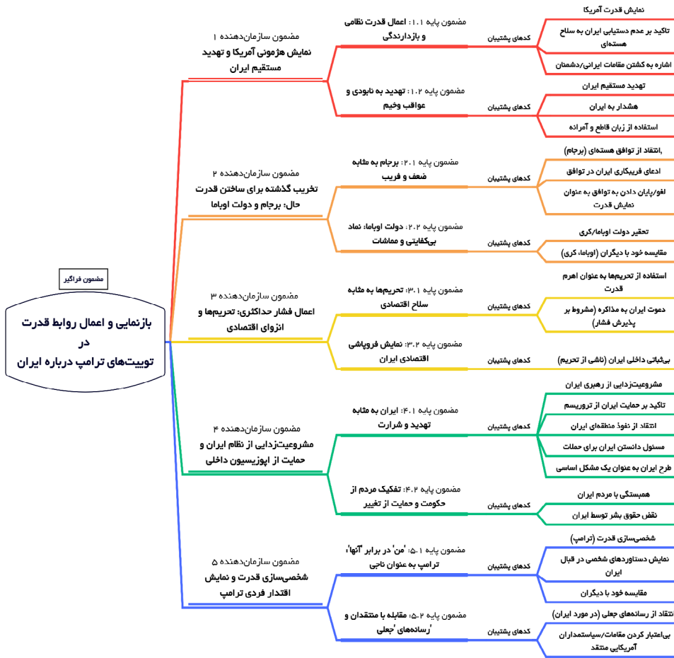
شکل ۲. ترسیم شبکه مضامین بازنمایی اعمال روابط قدرت در تویتهای ترامپ درباره ایران